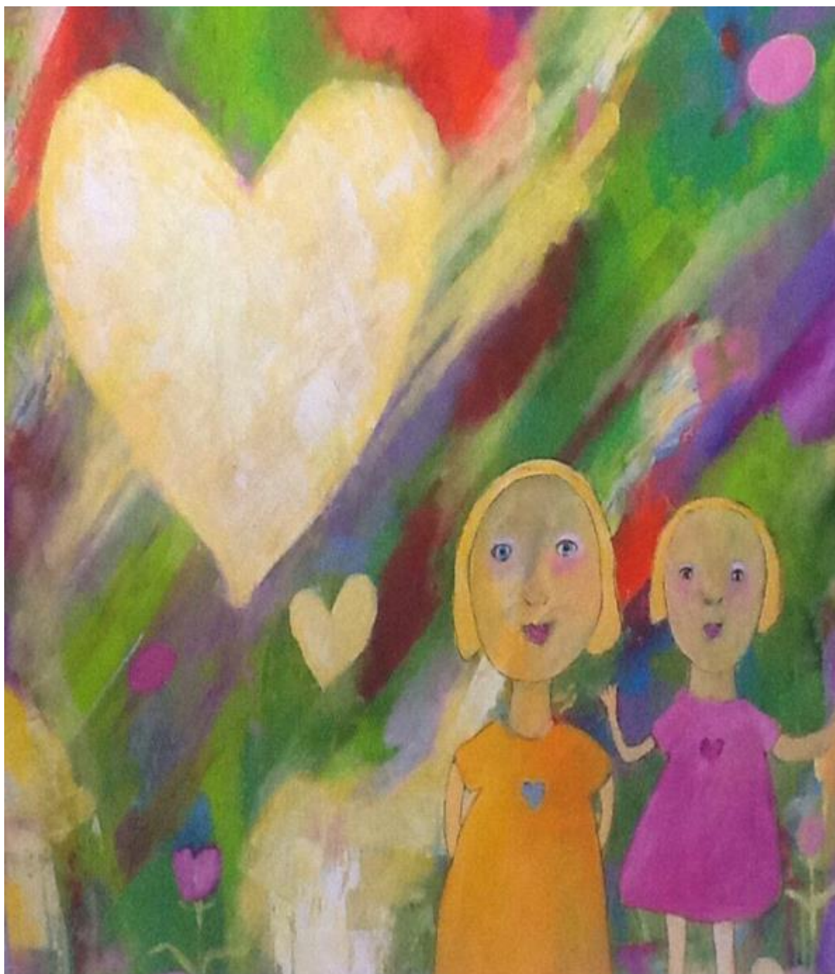
Laila Kvalsund Solhaug